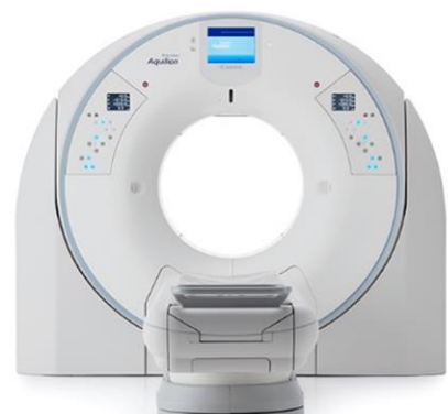
Canon 社製 16 列 CT 装置

しかし、最新機種では被ばく低減技術の進歩により、従来の三分の一程の被ばく線量で胸部 CT 検査が行えるようになりました。